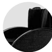
Accoudoirs en carbone (en option)