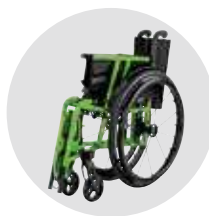
Largeur très étroite à l'état plié, de 280 mm pour carrossage de 0° ou 330 mm pour carrossage de 3°, hauteur à partir de 650 mm