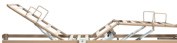
Lattes en métal