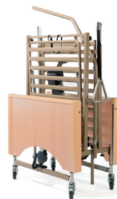
Livré sur Kit de transport