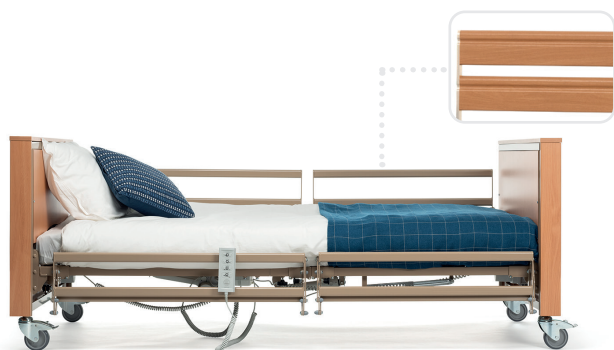
Demi-barrières (métal ou bois)