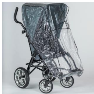
Capote + protection transparente