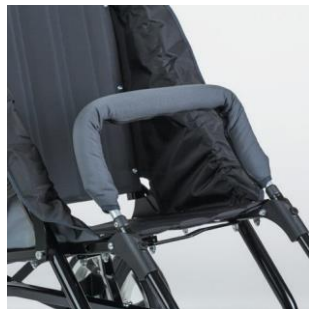
Barre de protection