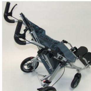
Frein de roulage