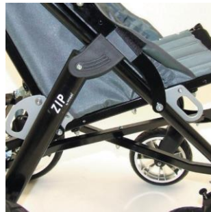
Sécurité de transport