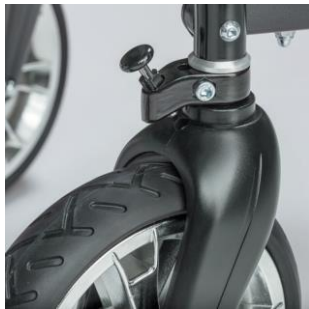
Arrêt roues pivotantes