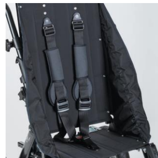
Ceinture 5 points